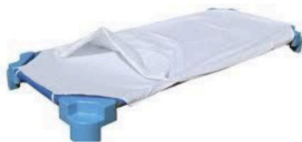
Mides del llençolet 132 x 53 cm.